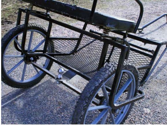
Bild 8. Ponnyrockard med fast dragkrok fastsvetsad på järnen som stabiliserar konstruktionen

Som grund för detta "rockardförställ" bör man välja en rockard av lite dyrare variant med rejäla hjul, justerbar skakellängd och hållbar konstruktion (finns från 7-8 000 kr och uppåt). Om rockarden har mopedhjul måste hjulet förses med plastkåpa som skyddar från grenar och dylikt, som kan fastna mellan ekrarna.