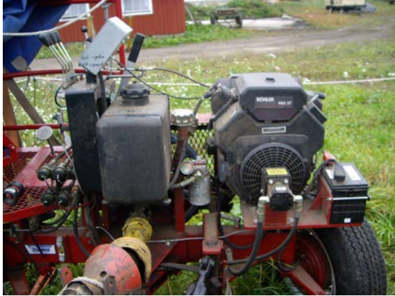
Bild 6. Förställ försett med hjälpmotor

När man använder så små hästar som det är fråga om i detta projekt blir lasterna inte så stora och därmed minskar påfrestningen på materialet i förstället. De ATV redskap som kan bli aktuella för en B- eller C ponny är också relativt lätta i sig. Vi testade därför ett billigt "hemsvetsat" förställ försett med en, i höjdd, justerbar dragkula fastsvetsad på axeln.