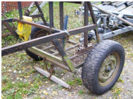
Bild 5. Stela skaklar försedd med svängel och draglinor

Många av de redskap vi sett, som varit försedda med både stela skaklar och svängel, har haft för korta skaklar och/eller för liten rörlighet för seltungan vilket gjort att hästen ändå tvingats dra med skaklarna. Man kan dock förse en fast skakel med ett cirka 150 mm långt beslag undertill där seltungan kan glida lätt fram och tillbaka. På så sätt kan hästen dra med hjälp av draglinorna medan skakeln framför allt fungerar som broms och uppbärare av redskapet.