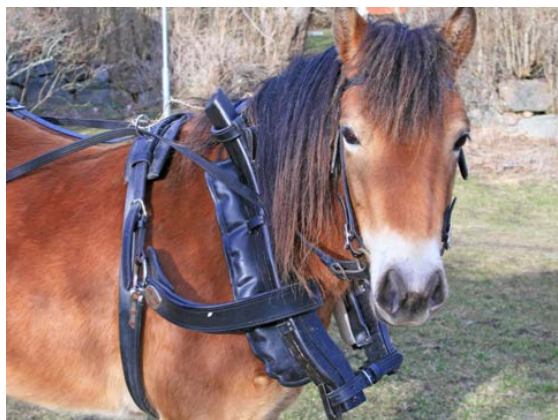
Bild 1. Gotlandsrusset Lojstas Bonita fick agera försökshäst i projektet.

Vi har under detta år identifierat behoven, inventerat marknaden av hästdragna redskap, skisserat vissa möjliga lösningar samt byggt en prototyp av ett lätt förställ. Som "försökshäst" i projektet har vi använt oss av gotlandsrusset Lojstas Bonita.