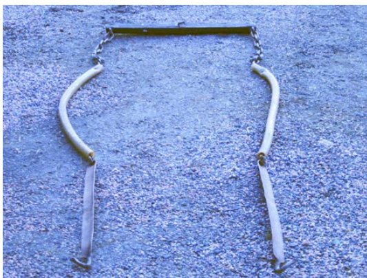
Bild 4. Draglinor och svänglar, som är försedd med krok för fastsättning av det dragna redskapet.

Redskap dragna med hjälp av draglinor är däremot mycket bra. Men eftersom draglinorna inte hindrar redskapet från att glida/rulla på hästen kan de bara användas till harvar, plogar, hackor osv.