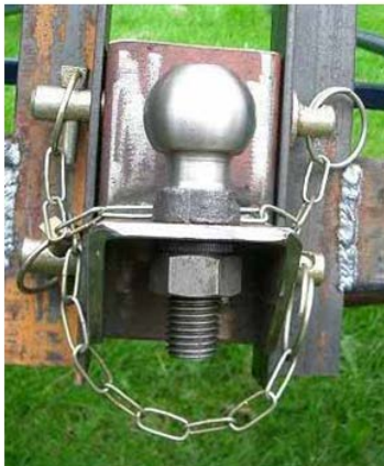
Bild 7. Fastsvetsad justerbar dragkrok

När man använder så små hästar som det är fråga om i detta projekt blir lasterna inte så stora och därmed minskar påfrestningen på materialet i förstället. De ATV redskap som kan bli aktuella för en B- eller C ponny är också relativt lätta i sig. Vi testade därför ett billigt "hemsvetsat" förställ försett med en, i höjdd, justerbar dragkula fastsvetsad på axeln.