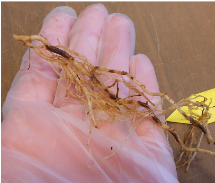
Korkrotsjuka på tomatrötter. De sjuka rötterna får bruna segment som spricker upp och ser ut som kork.

Korkrotsjuka är en allvarlig sjukdom som drabbar tomater och förstör rötterna. När rötterna blir sjuka bildas fläckar på rötterna som blir mörkbruna, spricker upp och får ett korkliknande utseende. Rotsystemet kan delvis ruttna bort och de viktiga finrötterna försvinner, vilket gör att tomatplantan får svårt att ta upp vatten och näring. Sjukdomen orsakas av en svamp som heter Pyrenochaeta lycopersici . Den här svampen är svår att isolera från rötterna och odla i laboratoriet. Den beskrevs därför inte förrän 1966, trots att man länge känt till de problem den kan orsaka.